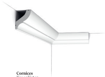
Cornices Kroonlijsten Corniches Eckleisten Cornisas Cornici Gzymisy

Productgamma Gamme de produits Produktreihe Gama de productos Gamma di prodotti Gama produktów